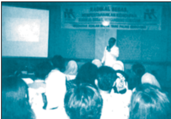
Presentasi Hasil Penelitian.

Mempresentasikan hasil-hasil penelitian merupakan suatu upaya untuk mensosialisasikan temuan-temuan hasil kerja peneliti. Misalnya seorang siswa ditugaskan oleh guru sosiologi untuk meneliti tentang akibat perkawinan dini pada remaja. Maka setelah melakukan kegiatan penelitian tersebut. Selain diminta melaporkan hasilnya dalam bentuk terbitan, juga akan lebih baik bermanfaat kalau diminta untuk mempresentasikan hasil-hasil penelitian tersebut.