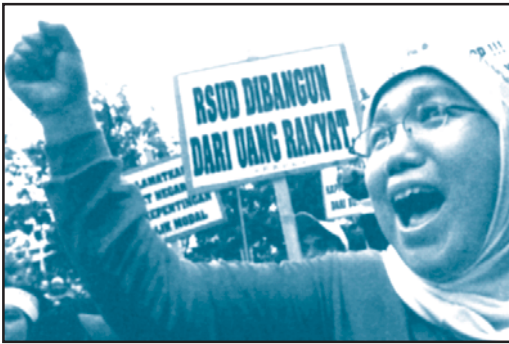
Ketidakpuasan masyarakat terhadap bidang kehidupan dapat mendorong terjadinya perubahan sosial yang cukup besar pengaruhnya.

Bidang-bidang kehidupan dalam masyarakat kadang-kadang tidak sesuai dengan kondisi dilingkungan masyarakat sekitar. Dari adanya ketidaksesuaian tersebut akan menimbulkan ketidakpuasan dalam masyarakat. Dengan adanya ketidakpuasan masyarakat dalam bidang kehidupan akan menimbulkan gejolak. Sebagai contoh, dalam bidang