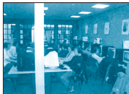
(Sumber: Sriwijaya Post, 5 Juli 2004) Internet sebagai bentuk kemajuan teknologi komunikasi dan informasi.

Pendidikan sebagai proses humanisasi menekankan pembentukan makhluk sosial yang mempunyai otonomi moral dan kedaulatan budaya.