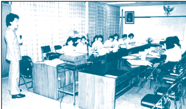
Sistem pendidikan formal yang maju merupakan faktor perubahan dan berpengaruh besar terhadap perubahan.

Pendidikan memberikan nilai-nilai bagi manusia untuk mengarah kepada pikiran secara ilmiah dan mampu menerima hal-hal yang baru. Pendidikan yang maju dalam lingkungan masyarakat akan mendorong masyarakat untuk melakukan perubahan.