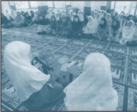
Peran dan fungsi lembaga agama sebagai sistem keyakinan.

agama adalah suatu sistem gagasan kepercayaan praktek dan hubungan. Bila tidak ada orang yang percaya dan tidak mau menerimanya maka agama tidak ada. Agama bukanlah manusianya, agama adalah suatu sistem keyakinan dan praktek.