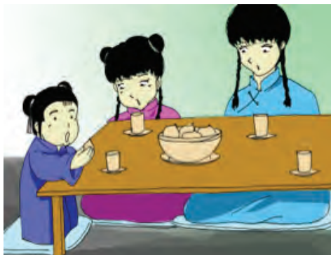
Gambar 7.8 Kasih sayang antarsaudara

Mereka membakar dupa yang amat harum, berlutut dan sujud sampai ke tanah, menyatakan syukur dan hormat kepada Tuhan. Inilah kegiatan religius terbesar setelah hari raya keagamaan orang Tionghoa: Imlek. Pada tanggal 8 menjelang tanggal 9 bulan pertama Imlek.