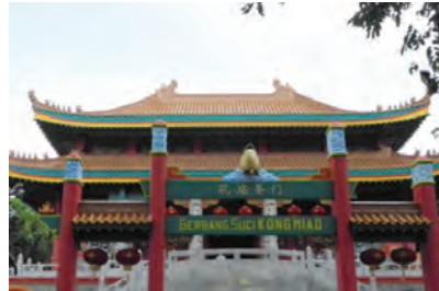
Gambar 6.2 Kongzi Miao Taman Mini Indonesia Indah.