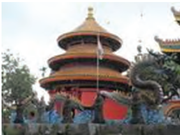
Gambar 6.1 Tian Tan tempat sembahyang kepada Tian yang berada di kompleks Kongmiao Taman Mini Indonesia Indah

Ruang kebaktian, tempat umat Khonghucu melaksanakan Ibadah bersama.