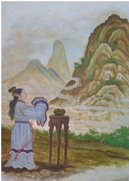
Gambar 3.2 Ibunda Yan Zheng Zai bersembahyang di bukit Ni