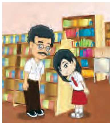
Gambar 7.6 Bertemu tetua di jalan segera memberi hormat

Bertemu tetua di jalan, segera memberi hormat. tetua berdiam diri, segera mundur dengan hormat.