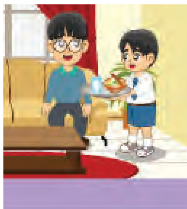
Gambar 7.7 Melayani paman seperti melayani ayah sendiri

Tetua sedang berdiri, yang muda jangan duduk, ketika tetua duduk, duduklah setelah diperintah.