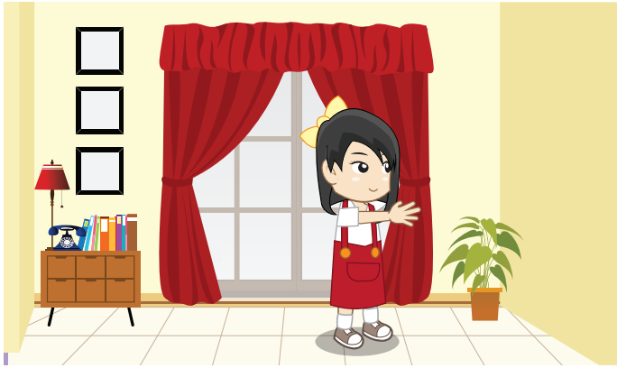
Gambar 7.3 Sikap lemah lembut dan penuh perhitungan

Saat masuk gerbang, tanya siapa penjaganya. saat masuk ruangan, suara harus dilantangkan.