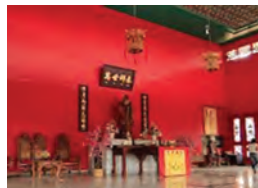
Gambar 6.4 Kongzi Miao Taman Mini Indonesia Indah.