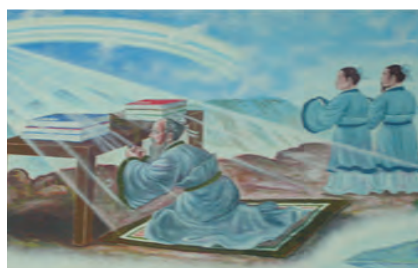
Gambar 4.5 Nabi Kongzi menyelesaikan penyusunan kitab-kitab