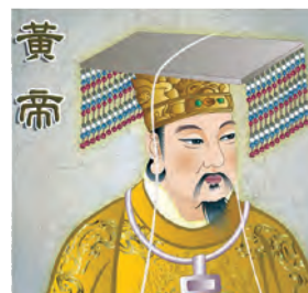
Gambar 2.3 Nabi Purba Huang Di (Bapak Ilmu Pengetahuan dan Raja Kebudayaan)

Huang Di memperoleh petunjuk Tuhan dalam mengemban tugas-tugasnya menetapkan hukum dan membimbing rakyatnya berbakti kepada Tuhan (beribadah) serta membina masyarakat dengan kebudayaan yang beradab, yang merupakan kodrat kemanusiaan, ditulis dalam Kitab Tiga Makam ( San Fen ), dan Kitab Huang Di Nei Jing .