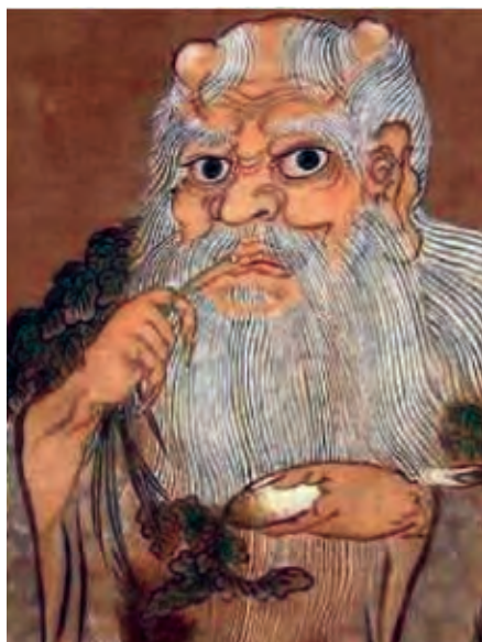
Gambar 2.2 Nabi Purba Shen Nong (Raja obat dan dewa pertanian)

Setelah Nabi Purba Shen Nong, dikenal Nabi Purba Huang Di (2698-2598 SM) bermarga Gong Shun bernama Xian Yuan. Dia berasal dari Henan. Dia menerima wahyu Liu Tu atau Peta Firman.