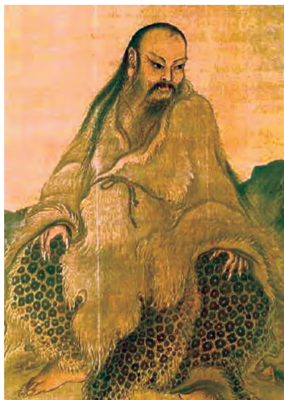
Gambar 2.1 Nabi Purba Fu Xi (2953 - 2838 SM.)

Di samping itu, beliau sangat berperan dalam mengajarkan kepada masyarakat zaman itu dalam hal pengolahan tanah serta pembudidayaan tanaman obat (herbal). Oleh karena itu, beliau mendapat julukan Dewa Pertanian dan Raja Obat .