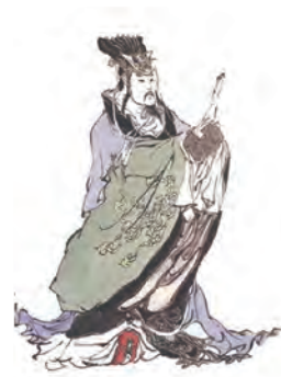
Gambar 2.5 Raja Suci Yu Shun (2255 SM. - 2205 SM.)