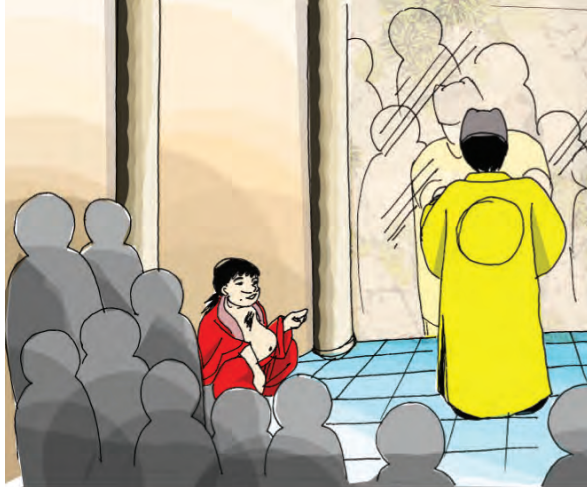
Gambar 5.2 Hati nurani manusia ibarat cermin yang akan memancar apa yang ada di dalam diri.

“Tidak mengapa, baginda yang mulia. Sudi kiranya baginda menitahkan agar tabir ruangan dibuka!” jawab kelompok seniman Zhongguo dengan penuh santun. Maka diangkatlah tabir yang memisahkan ruangan di antara kedua kelompok tadi.