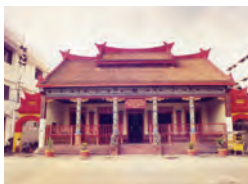
Gambar 6.3 Wen miao di jalan Kapasan Surabaya.

Rumah Abu leluhur, tempat umat Khonghucu berdoa memuliakan arwah leluhurnya.