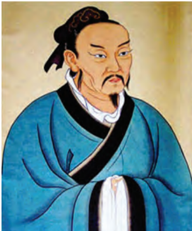
Gambar 4.7 Mengzi atau Mencius (tokoh besar kedua setelah Nabi Kongzi)

Bila menyimak sabda terakhir Nabi Kongzi , tampak jelas Nabi Kongzi menyadari tugas sucinya. Nabi Kongzi khawatir ajarannya tidak ada yang meneruskan. Karena murid terpandai yang diharapkan telah tiada. Cita-cita nabi mewujudkan Keharmonisan Agung, sebuah kehidupan ideal selaras dengan Jalan Suci, khawatir tidak ada yang melanjutkan.