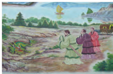
Gambar 4.4 Terbunuhnya Qilin dalam perburuan pangeran Ai ( Lu Aigong )

Pada tahun 479 SM. di usia 72 tahun, Nabi Kongzi menghembuskan nafas terakhirnya. Para murid telah memberikan perawatan ketika sang guru sakit. Sabda terakhir yang