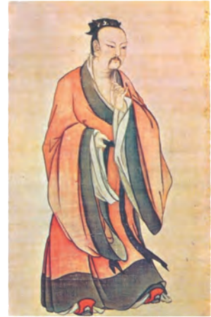
Gambar 2.4 Raja Suci Tang Yao (2357 - 2255 SM.)