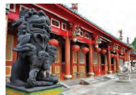
Gambar 6.5 Miao /Kelenteng di Kota Medan Sumatera Utara