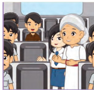
Gambar 7.5 Mendahulukan yang lebih tua

Tetua memanggil seseorang, segera bantu memanggilkan. yang dipanggil tak ditempat, kita segera menghadap. menyapa yang dituakan, jangan memanggil nama. menjawab yang dituakan, jangan pamer kemampuan.