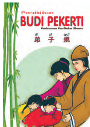
Gambar 7.1 Buku Pendidikan Budi Pekerti Di Zi Gui

Buku yang menerangkan tentang budi pekerti seorang anak manusia ini, merupakan penyederhanaan (bersifat aplikatif) yang merujuk langsung dari Kitab Suci agama Khonghucu, Kitab Sabda Suci ( Lunyu ) berdasarkan Sabda-Sabda Nabi Kongzi, ditulis oleh Li Yu Xiu di zaman Raja Kang Xi (tahun 1662-1722), dinasti Qing ( Qing Chao , tahun 1644-1911).