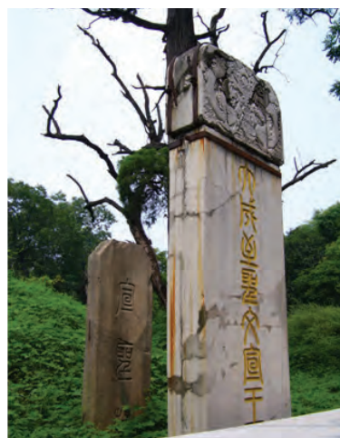
Gambar 4.6 Nabi Kongzi dimakamkan di kota Qu Fu , di dekat sungai Si Shui