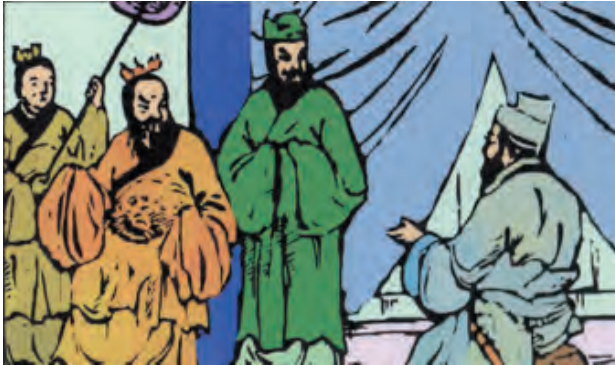
Gambar 4.3 Nabi Kongzi di negeri Wei

Wei Ling Gong sebenarnya seorang yang cukup baik, tetapi ia sangat lemah, peragu dan tidak mempunyai ketetapan hati. Di dalam pemerintahan ia sangat dikuasai oleh Nanzi , seorang selir dari Negeri Song yang kemudian dijadikan permaisuri, ditambah dengan pengaruh yang besar dari Wang Sun Jia , seorang menteri yang sangat dikasihi karena pandai menjilat.