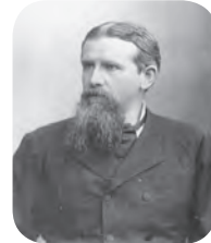
Sumber: www.wikipedia.org Gambar 8.2 Frederich Ratzel

Frederich Ratzel (1844–1904) berpendapat bahwa negara itu seperti organisme yang hidup. Negara identik dengan ruangan yang ditempati oleh sekelompok masyarakat (bangsa). Pertumbuhan negara mirip dengan pertumbuhan organisme yang memerlukan ruang hidup yang cukup agar dapat tumbuh dengan subur. Semakin luas ruang hidup maka negara akan semakin bertahan, kuat, dan